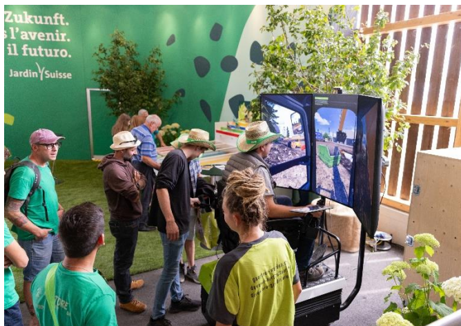
Selber Probieren am Baumaschinen-Simulator.

Gestern um 11 Uhr wurde die Sonderschau "heute- morgen- ÜBERMORGEN" im Beisein von zahlreichen Ausstellern und Gästen eröffnet.