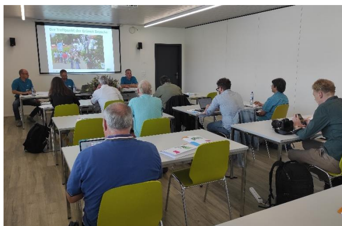
Medienempfang im ÜK-Zentrum.

Die ÖGA-Messeleitung hat gestern diverse Pressevertreter - v.a. der Fachpresse - empfangen. Diese informierten sich über Trends, technische Neuheiten, neue Pflanzen, die Sonderschauen und Veranstaltungen. Während allen drei Tagen haben sich Medienschaffende für einen Messebesuch angemeldet